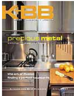
Kitchen and Bath Business